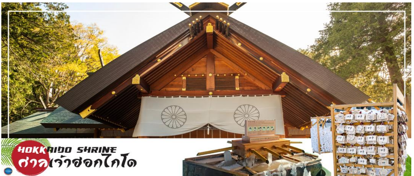
HOKKAIDO SHRINE ศาลเจ้าฮอกไกโด

นำท่านขอพร ศาลเจ้าฮอกไกโด (Hokkaido Shrine) หรือเดิมชื่อ ศาลเจ้าซัปโปโร เปลี่ยนเพื่อให้สมกับ ความยิ่งใหญ่ของเกาะเมืองฮอกไกโด ศาลเจ้าชินโตนี้คอยปกป้องรักษาให้ชนชาวเกาะฮอกไกโดมีความสุขถึงแม้จะไม่ได้มีประวัติศาสตร์อันยาวนาน