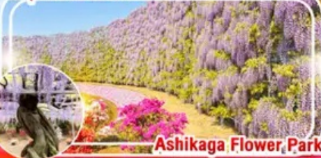
Ashikaga Flower Park