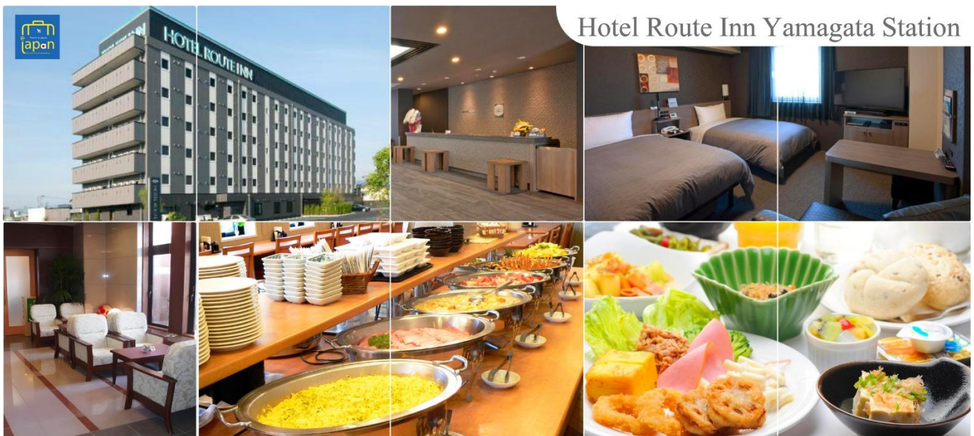
Hotel Route Inn Yamagata Station

ที่พัก HOTEL ROUTE INN YAMAGATA STATION หรือเทียบเท่าระดับเดียวกัน