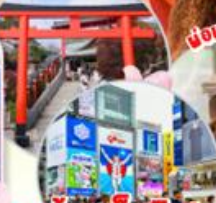
พร้อมเชคอิน! ป้ายกูลิโกะแมน