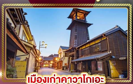
เมืองเก่าคาวาโกเอะ