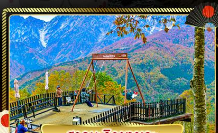
ฮาคุบะฮิวาตากะ