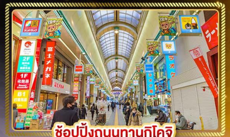
ช้อปปิ้งถนนทานุกุโคจิ