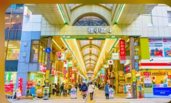
ซุปป์ิงถนนทากุทิจิ