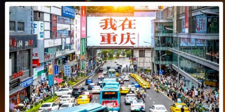
ถนนอาหารกวนอันเดียว