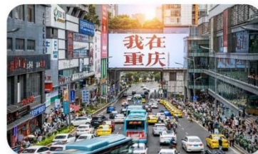
ถนนอาหารกวนอันเฉียว