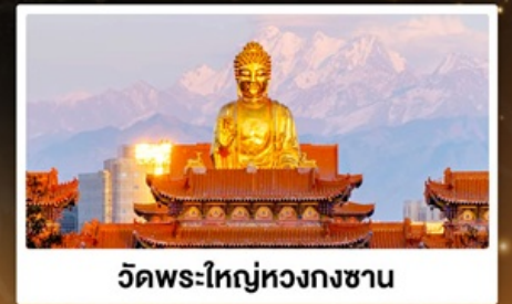
วัดพระใหญ่หวงกงซาน