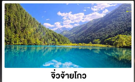
จิ่งจ้ายโกว