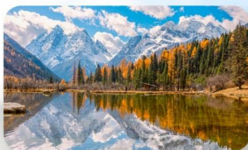
สี่ครุณี