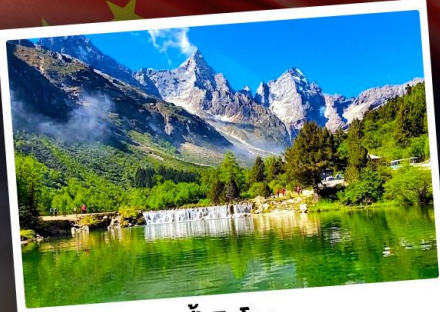
ปี้เฉิงโกว