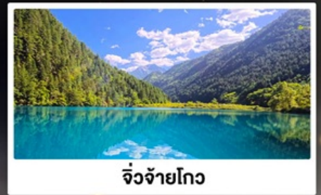
จิ้งจ้ายโกว