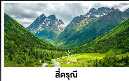
สี่ดรุณี