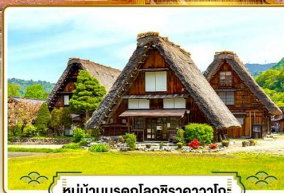
หมู่บ้านมรดกโลกชิราคาวาโกะ

✓ ซอปปิงย่านฮิตที่สุดในโอซาก้า "ชินโซบาชิ"