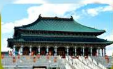
พระราชวังต้องห้ามออร์ดอส