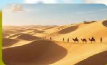
เหมินทรายอินเคินทาลา