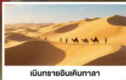
เนินทรายอินคินทาลา