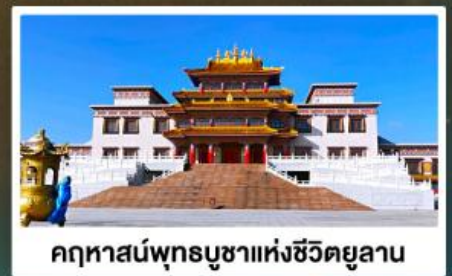
คฤหาสน์พุทธบูชาแห่งชีวิตยูลาน