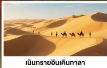
เนินทรายอินเคินทาลา