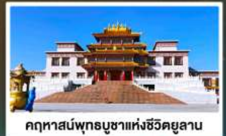
คฤหาสน์พุทธบูชาแห่งชีวิตยูลาน