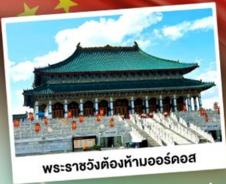
พระราชวังต้องห้ามออร์ดอส

ตะลุยเนินทรายร้องเพลง แห่งมองโกเลียใน ชมวิวทุ่งหญ้าโล่งกว้างตัดขอบฟ้าคราม