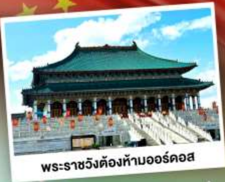
พระราชวังต้องห้ามออร์ดอส

ตะลุยเนินทรายร้องเพลง แห่งมองโกเลียใน ชมวิวทุ่งหญ้าโล่งกว้างตัดขอบฟ้าคราม