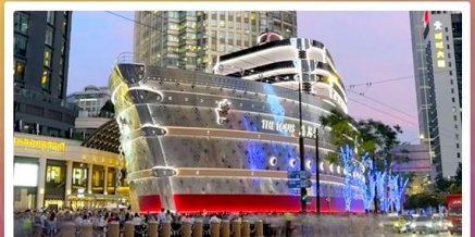
เรือหลุยส์วิตตอง