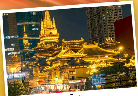
วัดจิ่งอัน

เที่ยว 2 เมือง หางโจว-มหานครเซี่ยงไฮ้ ตะลุยเมืองซูโทเปีย ชมพลาซาดิสनीแลนด์สุดอลังการ