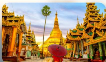
วัดจิ้งอัน