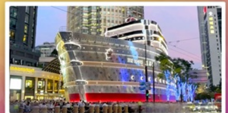
เรือหลุยส์วิตตอง