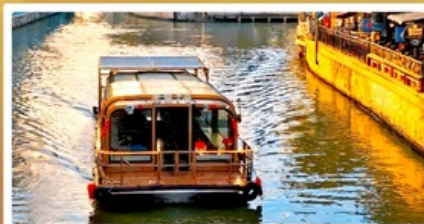
ล่องเรือ Grand Canal