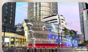
เรือหลุยส์วิตตอง