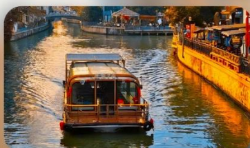
ล่องเรือ Grand Canal