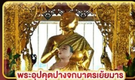
พระอุปคุตปางจากบาตรเขี้ยวมา