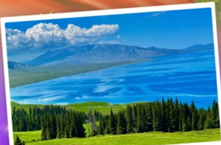
ทะเลสาบโซหลี่มู่

เที่ยวทุ่งหญ้าล่องฟ้านาราตี ชมความสวยงามทะเลสาบโซหลี่มู่