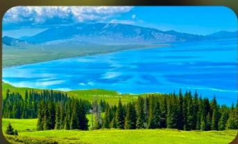
ทะเลสาบโซหลี่มู่