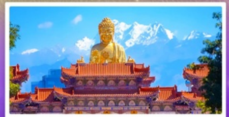
วัดพระใหญ่ทงกวงซาน