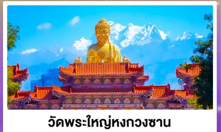
วัดพระใหญ่ห่งกวงซาน