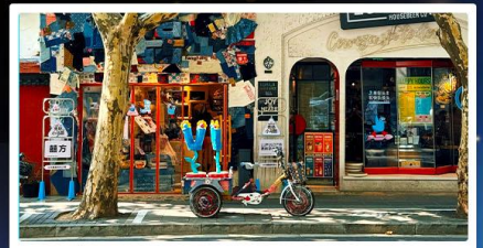
ถนนอันฟู