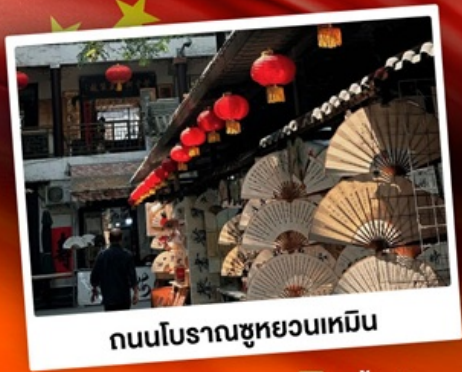
ถนนโบราณซูหยวนเหมิน

"มรดกโลกพันปี สุสานทหารดินเผา" แต่งชุดจีนโบราณ เดินถนนวัฒนธรรมต้าถิง