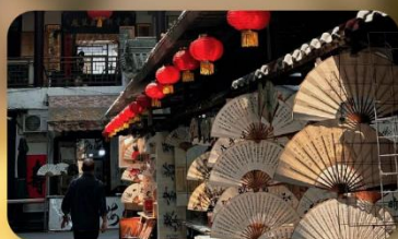
ถนนโบราณซูหยวนเหมิน