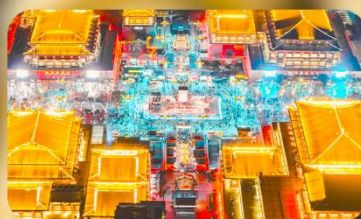
ถนนวัฒนธรรมต้าถิง