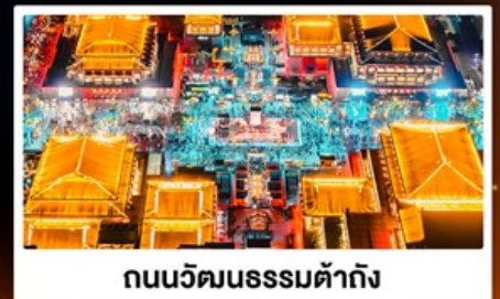
ถนนวัฒนธรรมต้าถิง