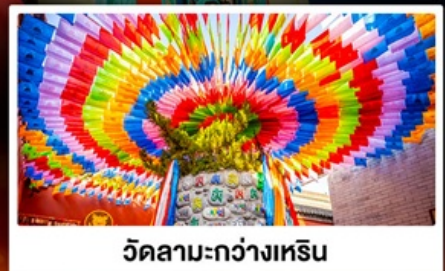
วัดลามะกว้างเหริน