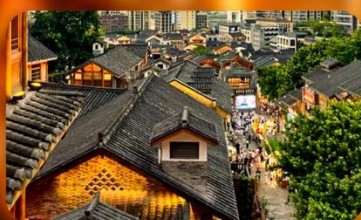
เมืองโบราณสี่ปาตี