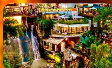
ถนนโบราณหลงเหมินอ่าว