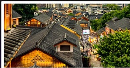
เมืองโบราณสี่ปาที้