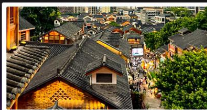
เมืองโบราณสี่ปาที้