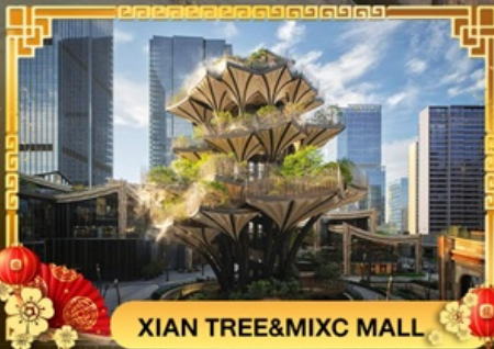
XIAN TREE&MIXC MALL