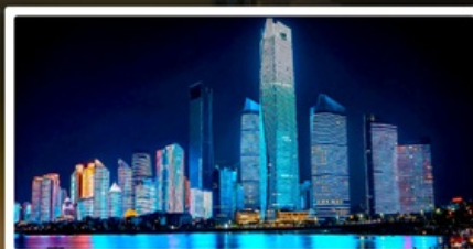
หาดไซเบอร์ฟังก์