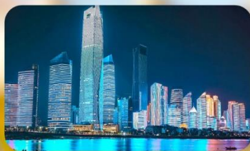
หาดไซเบอร์ฟังก์