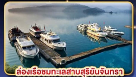
ล่องเรือมทะเลสาบสุริยันจันทรา