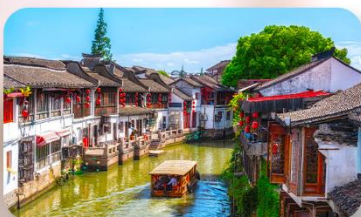
เมืองโบราณจูเจียวเจียว