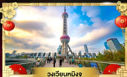
วงเวียนหมีงู