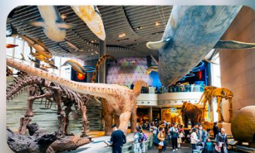
พิพิธภัณฑ์เซี่ยงไฮ้