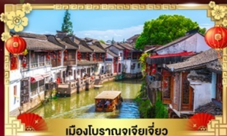
เมืองโบราณอูเจียเจียว

สนุกเต็มพิกัด "สาวเสกเกดิสเนย์แลนด์เซี่ยงไฮ้"