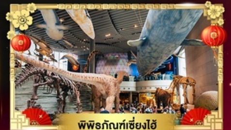
พิพิธภัณฑ์เซี่ยงไฮ้