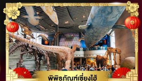
พิพิธภัณฑ์เซี่ยงไฮ้