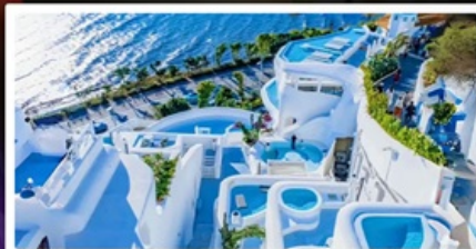
ซาไดร์นี่