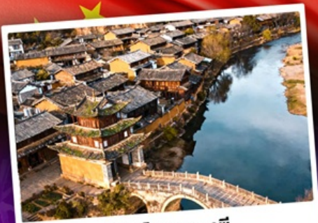
เมืองโบราณซาซี

ชมดอกไม้บานสะพรั่งทั่วยูนนาน "เซ็ดอี่แฉดาเฟ้ววี่สุดอลัง"