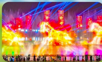
น้ำพุดนตรีคังปาสือ