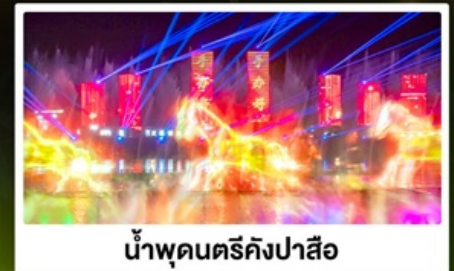
น้ำพุดนตรีคังปาสือ