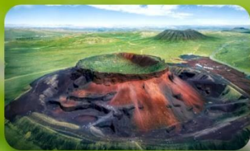
ภูเขาไฟอูลันดา

JINGSHA INTERNATIONAL HOTEL หรือเทียบเท่า 4 ดาว