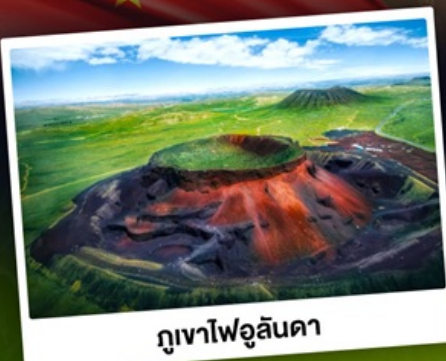
ภูเขาไฟอูลันดา

ท่องเที่ยวแดนแห่งทะเลทรายและทุ่งหญ้า ชมพระอาทิตย์ขึ้นทุ่งหญ้าออร์ดอส