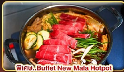
พิเศษ.. Buffet New Mala Hotpot Free Flow Beer & Soft Drink