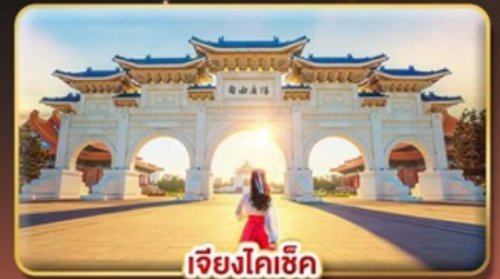
เจียงไคเซ็ก