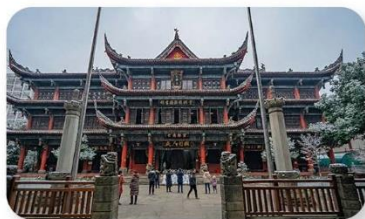
วัดเหวินซู