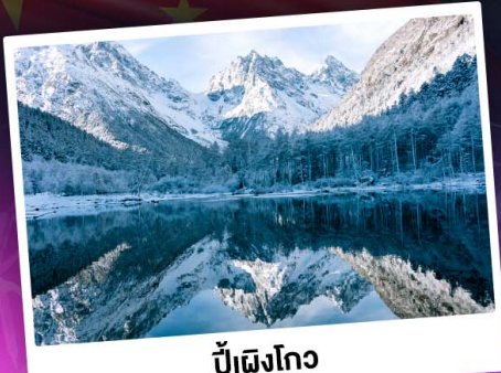
ป่าเผิงโกว

ท่องเขาแอลป์เมืองจีน "ภูเขาสี่ดรุณี" ชมความสวยงามของอุทยานป่าเผิงโกว