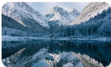
ปี้ฝิงโกว