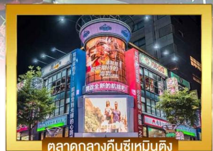
ตลาดกลางคืนซีเหมินติง