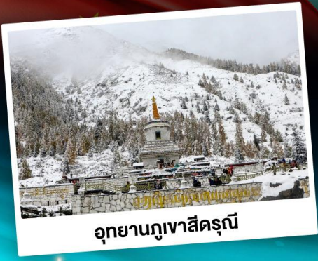
อุทยานกู๋เจาสีครุณี