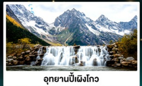
อุทยานปี้ฝิงโกว