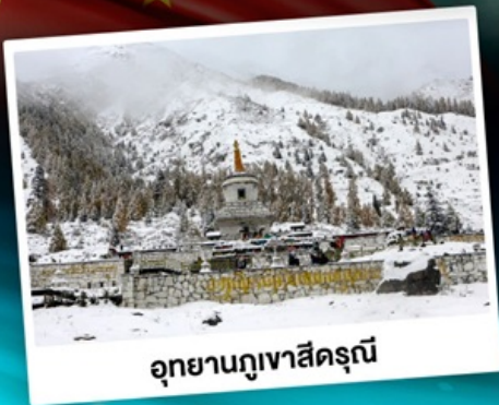
อุทยานกุเวาสีครุณี

เที่ยว 3 อุทยานสวรรค์ สัมผัสบรรยากาศหน้าหนาว "แดนมังกร"