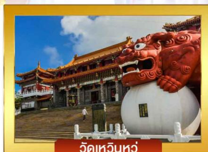
วัดเหวินหลู่