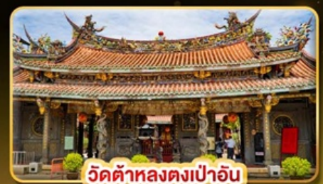
วัดต้าหลงตงเป่าอัน