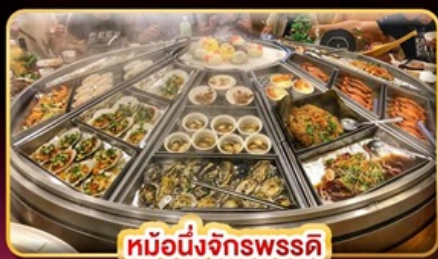
หม้อนึ่งจักรพรรดิ

แพคเกจรวมตั๋วเครื่องบิน บินคุ้ม เที่ยวครบ เช็किनจุดไฮไลท์