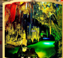
ถ้ำน้ำเป่ย์ซี