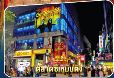
ตลาดซีเหมินตง

เมนูพิเศษ ! Buffet Shabu, Taiwan Seafood