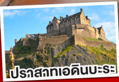
ปราสาทเอдинบะระ