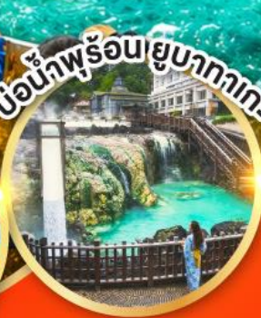
เขื่อนน้ำพุร้อนยูบะฮากา