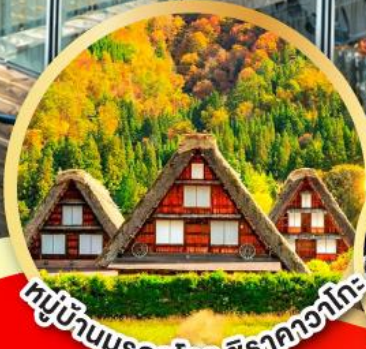
หมู่บ้านมรดกโลก ชิราคาวาโกะ