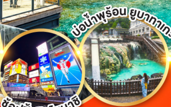
แช่น้ำพุร้อน ยูบาคาโกะ ช้อปปิ้งชินโซบาชิ