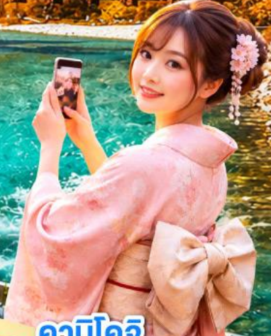
คาบิโดจิ