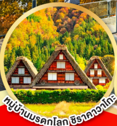
หมู่บ้านมรดกโลก ชิราคาวาโกะ