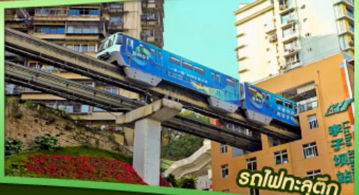
รถไฟเหาะลัดคด