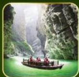
ล่องเรือแม่น้ำไตตั้นกูฮิว