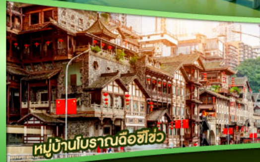
หมู่บ้านโบราณฉือฮิว