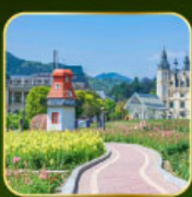
สวน Alice's Garden