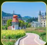
สวน Alice's Garden