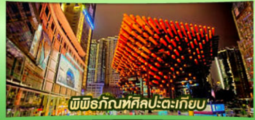
พิพิธภัณฑ์ศิลปะตะเกียบ