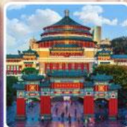
ศาลาประชาคมฉงชิ่ง