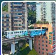
รถไฟฟ้า-ลัด