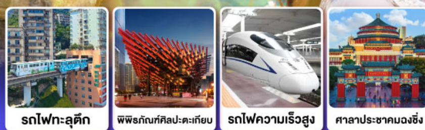
รถไฟทะลุติ๊ก