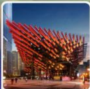
พิพิธภัณฑ์ศิลปะ-เทียน