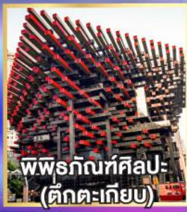
พิพิธภัณฑ์ศิลปะ (ตึกตะเกียบ)