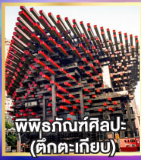
พิพิธภัณฑ์ศิลปะ (ตึกตะเกียบ)