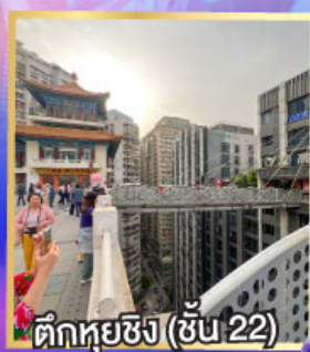
ตึกหุ่ยซิง (ชั้น 22)