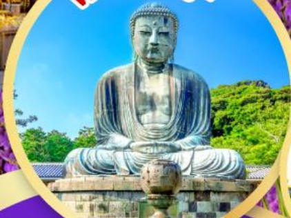
หลวงพ่อโต ไคบุคสึ