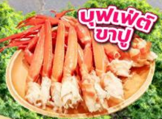
บุฟเฟ่ต์ ซาซุ