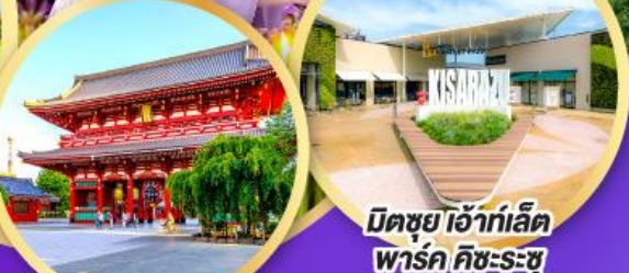
มิตซูโฮะอิเกะ พาร์ค คิชะระชู