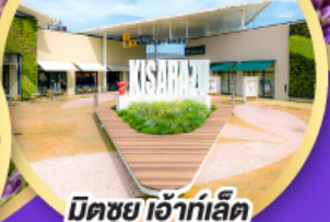
มิตซูเอะอิเกะอิชิอิ พาร์ค คิซะระซู