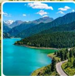
อุทยานเทียนชาน เทียนฉือ