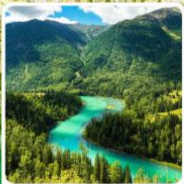
ทะเลสาบคานาสีอ