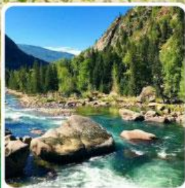
อุทยานเคอเคอแก้วไห้