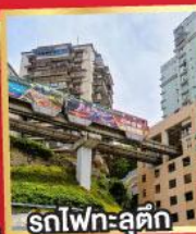
รถไฟทะลุตึก