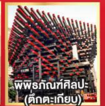
พิพิธภัณฑ์ศิลปะ (ตึกตะเกียบ)