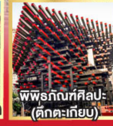
พิพิธภัณฑ์ศิลปะ (ตึกตะเกียบ)