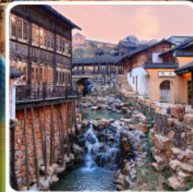
เมืองโบราณเหย้าหู