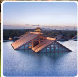
พิพิธภัณฑ์ไดน้ำกวางฟู่หลิน