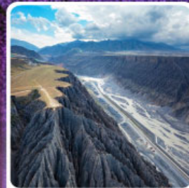
แกรนด์แคนยอนคู่ซานจื่อ