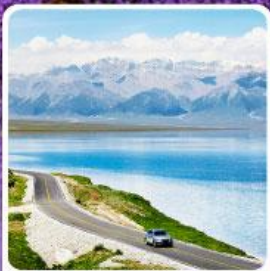
ทะเลสาบไซไห่หลี่มู่