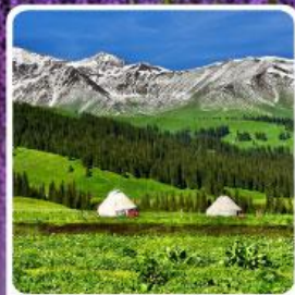
ทุ่งหญ้านาลาติ