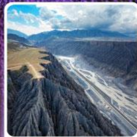
แกรนด์แคนยอนตูซันจื่อ