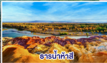
ธารน้ำห้าสี