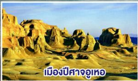
เมืองปีศาจจู่เหอ