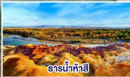
ธารน้ำห้าสี