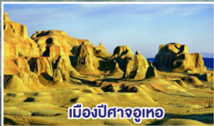
เมืองปีศาจจวูเหอ