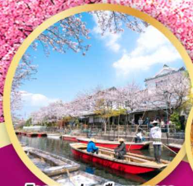
กิจกรรมล่องเรือยานากะ