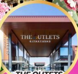
THE OUTLETS KITAKYUSHU