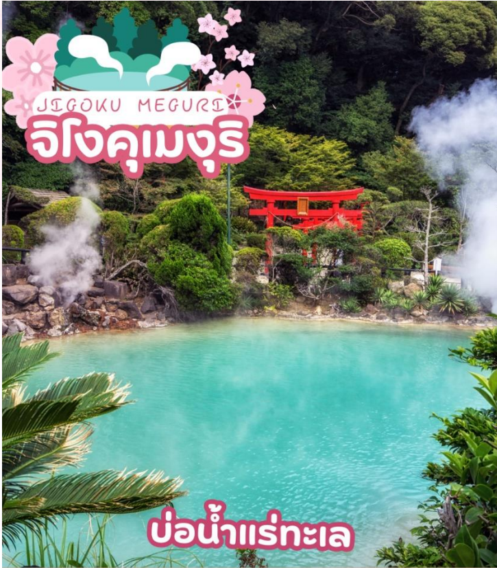
บ่อน้ำแร่ทะเล

หมู่บ้านยูฟูอิน (YUFUIN FLORAL VILLAGE) เป็นหมู่บ้านเล็กๆที่อยู่ในจังหวัดโออิตะห่างจากเมืองบ่อน้ำร้อนเบปปุประมาณ 10 กิโลเมตร หมู่บ้านแห่งนี้เป็นหมู่บ้านหัตถกรรม และยังเป็นทีรวบรวมแบบบ้านต่างๆในประเทศญี่ปุ่นที่มีอายุตั้งแต่ 120-180 ปีมารวมไว้ที่นี่อีกด้วย ที่นี่จึงจัดได้ว่าเป็นพิพิธภัณฑ์ที่มีชีวิตที่สามารถดึงดูดนักท่องเที่ยวให้เดินทางมาเยี่ยมชมได้ตลอดทั้งปี จากนั้นพบความงามของ ทะเลสาบคิริน (Kirin Lake) น้ำทะเลสาบใสเห็นตัวปลาแหวกว่ายในผืนน้ำ บางช่วงมีหมอกบางๆ ลง นับว่าคุ้มค่ากับการมาเห็นความงามนี้ด้วยตาตัวเองสักครั้งนึ่งอย่างแน่นอน อิสรระให้ท่านเดินเล่นและถ่ายรูปตามอัธยาศัย