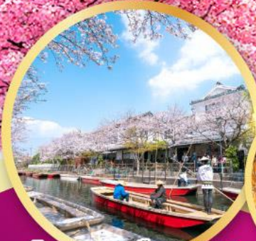
กิจกรรมล่องเรือยานากาโตะ