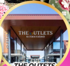
THE OUTLETS KITAKYUSHU