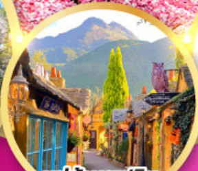
หมู่บ้านยูฟูอิน พลอร์ริล