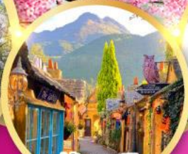
หมู่บ้านยูฟูอิน พลอร์รัล