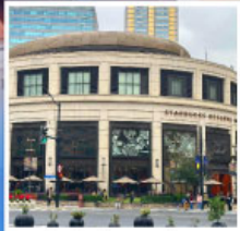
Starbucks Reserve Roastery