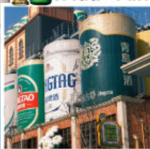
พิพิธภัณฑ์โรงเบียร์ชิงเต่า