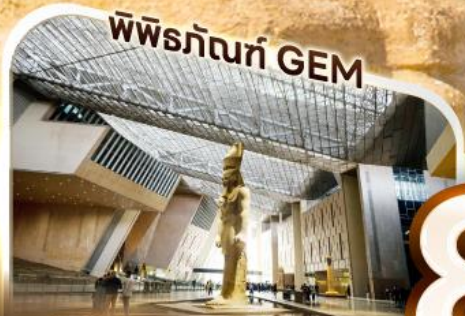
พิพิธภัณฑ์ GEM