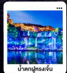
น้ำตกฝูหลงจิ้น

"มหัศจรรย์...จางเจียเจีย" | ดินแดนแห่งขุนเขาและสายน้ำ "เขาเกียนเหมินซาน" | ประตูล่องเรือ...ท่าอากาศยาน 999 ชั้น | นั่งรถไฟความเร็วสูง สัมผัสความสวยงามระบียงแก้ว "อุทยานอวตาร" | ส่องล่องกลางขุนเขา...ดั่งภาพฝันในห้วงนเจียเจีย | ช้อปปิ้ง POPMART "เมืองโบราณ" ฝูหลง" หยุดเวลา ณ เมืองบนม่านน้ำตก... | "เฟิ่งหวง" ส่องเรือชมชีวิตริมแม่น้ำทิวเจียง "นครฉางซา" ปิดท้ายความทันสมัย