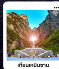
เกียนเหมินซาน