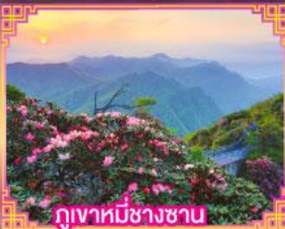
ภูเขาหมีขาซาง