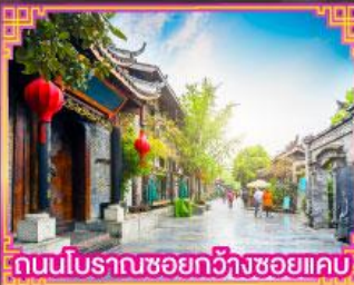
ถนนโบราณชอยกวางฮวยเคบ