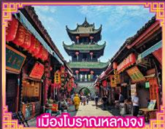
เมืองโบราณหลางจง