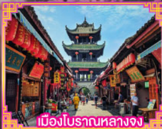
เมืองโบราณหลางจง