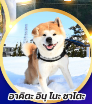
อาคิตะ อินุ โนะ ซาโตะ