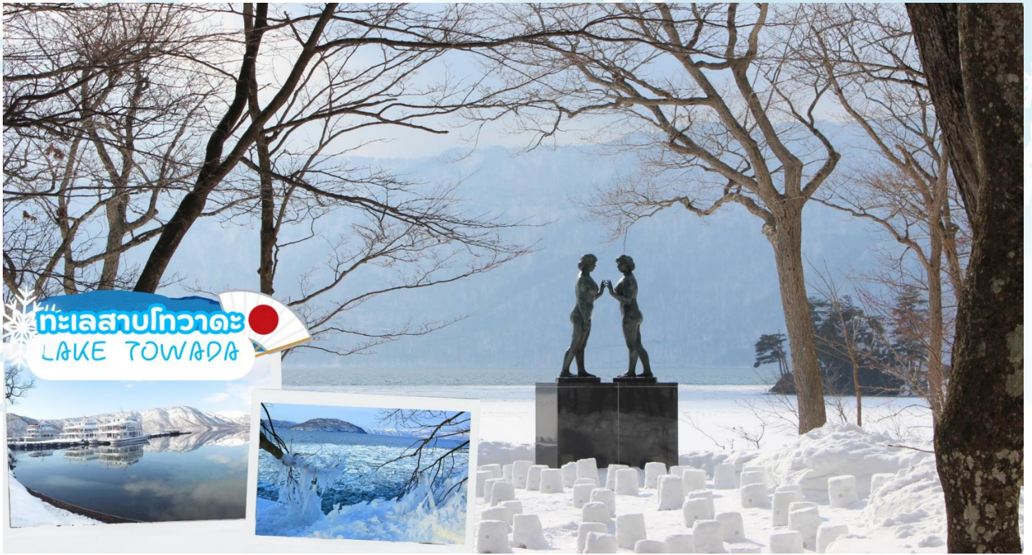
ทะเลสาบโทวาดะ LAKE TOWADA

กลางวัน รับประทานอาหารกลางวัน ณ ร้านอาหาร (มื้อที่ 4)