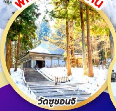
วัดชูซอนจิ