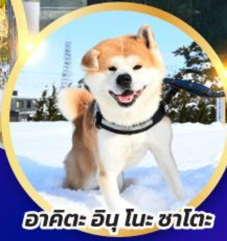
อาคิตะ อินุ โนะ ซาโตะ