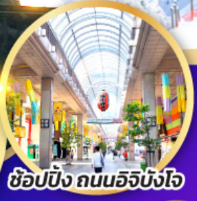
ช้อปปิ้ง ถนนอิจิบังโจ