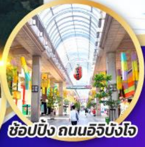
ซ็อบบิง ถนนอิบิงโจ