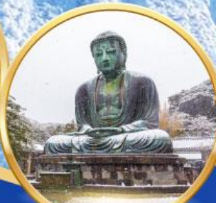
หลวงพ่อโต โดบุตสึ