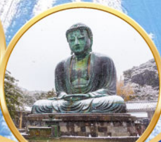
หลวงพ่อดโต โดบุตสึ